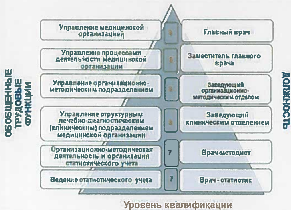
Рисунок 1 – Обобщенные трудовые функции и уровни квалификации в соответствии с должностями профессионального стандарта «Специалист в области организации здравоохранения и общественного здоровья»

Для включения претендента в Резерв необходимо оценить его профессиональный уровень по отдельным блокам Модели компетенций – способность решать профессиональные задачи на основе знаний и умений, а также опыта практической деятельности, которые непосредственно связаны с проявлением личностных характеристик и мотиваций будущего специалиста в области управления в сфере здравоохранения (Таблица 1).